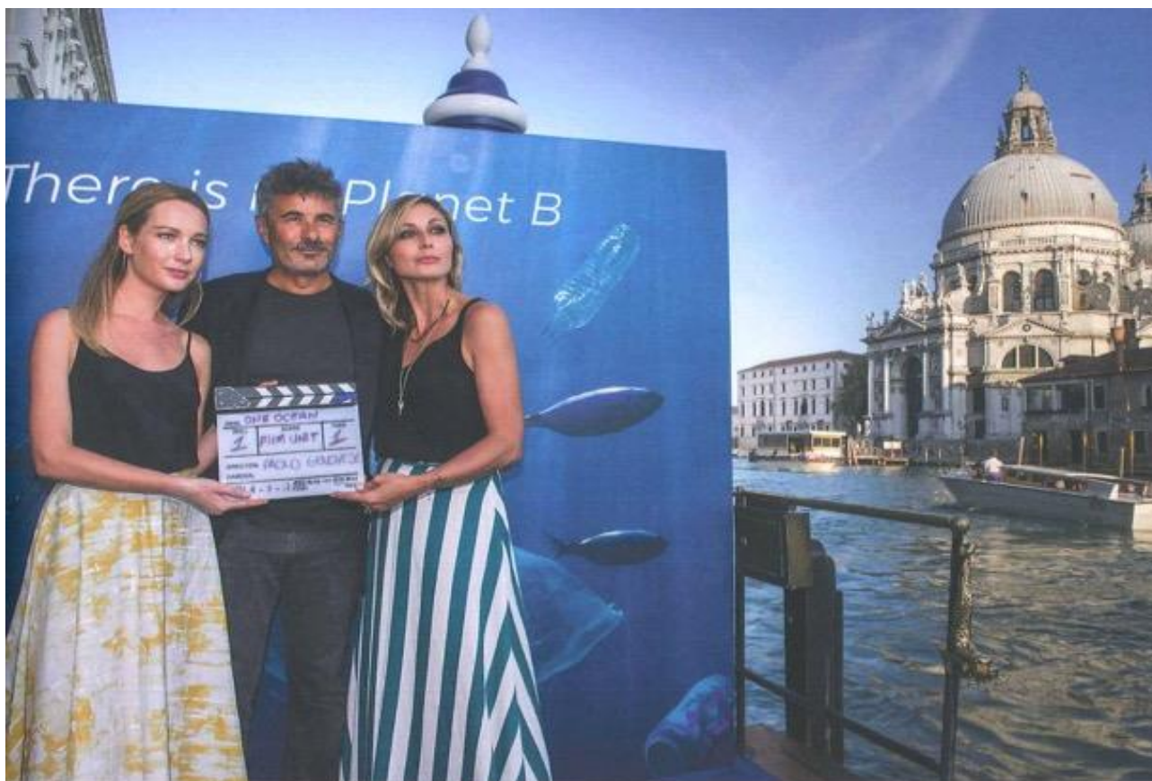
The actress Cristiana Capotondi participated at the project "Periplus for the protection of the sea"

il motto della nostra Fondazione è "There is no Planet B". Occorre pensare su scala globale e guardare al futuro delle prossime generazioni.